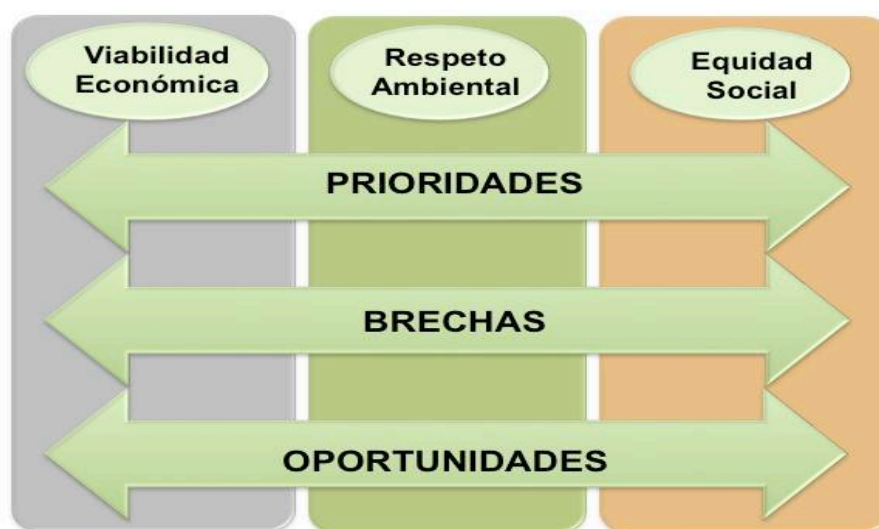
Fig. 1: Temas y variables de la consulta

Durante la consulta, los participantes se dividieron en tres grupos de trabajo de acuerdo a sus intereses y experiencia en una de las áreas temáticas. Se llevaron a cabo tres sesiones, cada una compuesta por tres grupos de trabajo paralelos de entre 13 y 14 expertos. El objetivo de cada una de las sesiones fue la identificación de “prioridades”, “brechas” y “oportunidades” en relación a las tres dimensiones clave de la nueva agenda mundial de desarrollo (viabilidad económica, respeto ambiental y equidad social (Fig. 1).